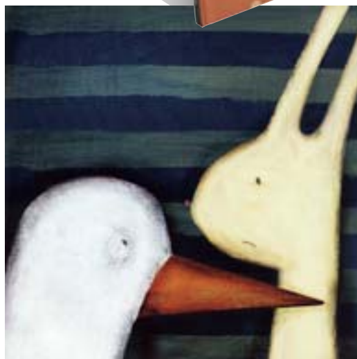
Ilustración de Cerca , realizada por Natalia Colombo .

NATALIA COLOMBO Cerca (Kalandraka, 2008)