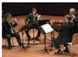
ARDITTI QUARTET Cuartetos de Cristóbal Halffter (Auditorio 400. Museo Nacional Centro de Arte Reina Sofía. 26 de enero de 2008)

¡Soberbio! Es el comentario de un espectador de este concierto. Y no es para menos. El Arditti Quartet, fundado por el primer violín Irvine Arditti en 1974 es hoy uno de los cuartetos de cuerda más prestigiosos del mundo. Dentro de la programación del Centro para la Difusión de la Música Contemporánea (CDMC) interpretaron tres cuartetos de Cristóbal Halffter en un concierto intenso, emocionante y muy bello. Las filigranas compositivas y la complejidad de las obras de Halffter no impiden la hondura emocional, la riqueza sonora y la sensación de que estamos ante arte mayúsculo. El compositor, que subió al escenario, se llevó un regalo que el cuarteto le hizo: la interpretación del último movimiento de su primer cuarteto (1954) fuera de programa. Lo dicho, ¡soberbio! / J.H.