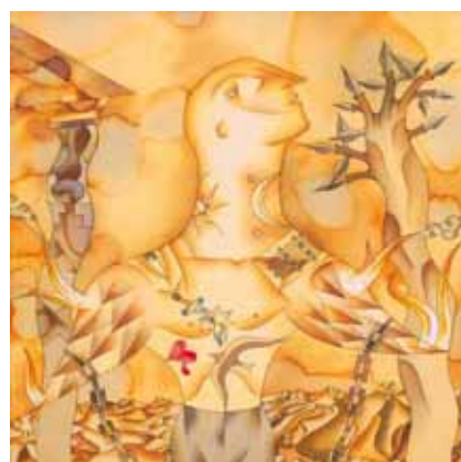
Miguel Hernández, 25 poemas ilustrados