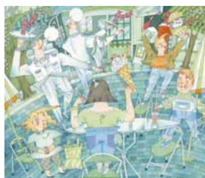
Libro de las M'Alicias