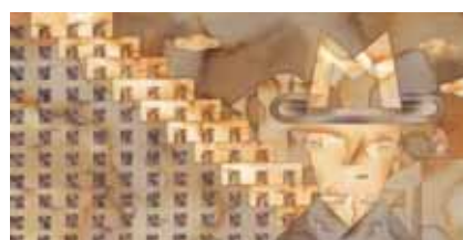
Al pie de la letra